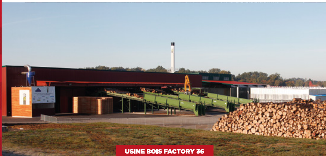
USINE BOIS FACTORY 36

Restaurant de l'hôtel Mercure Porte de Sologne à Orléans